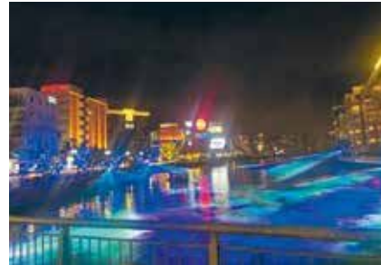
〈那珂川のライトアップ〉