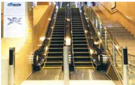
〈博多駅筑紫口エスカレーター〉