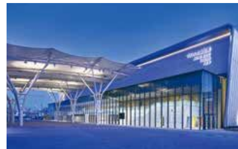
〈マリンメッセ福岡B館〉