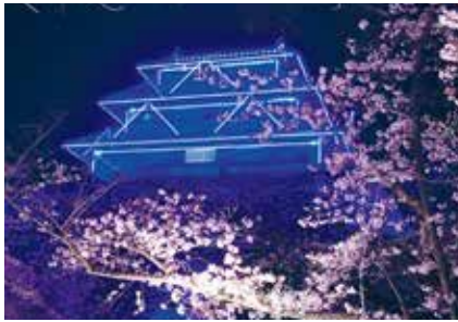
〈福岡城幻の天守閣ライトアップ〉