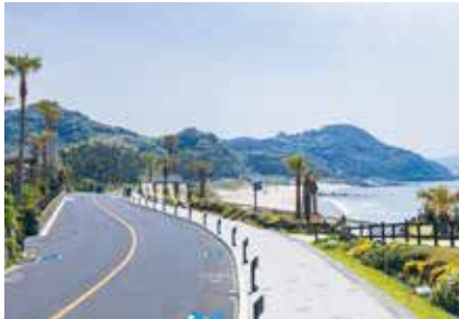
〈北崎地区の無電柱化された道路〉