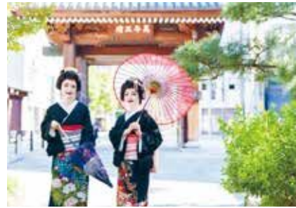
〈博多旧市街での着付け体験〉