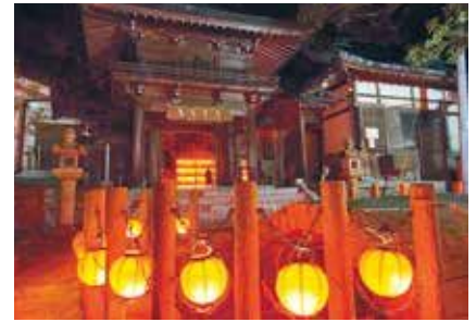
〈志賀島地区のにぎわい創出〉