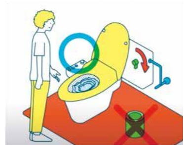
〈観光客向けマナー動画〉