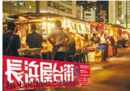
〈長浜屋台街プロモーション〉