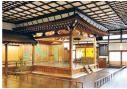
〈住吉神社能楽殿リニューアル〉