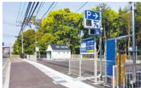
〈生の松原元寇防塁の駐車場〉