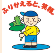
口座振替加入勧奨キャラクター ふりかえる君

「口座振替依頼書」に必要事項を記入・金融機関登録印を押印のうえポストに投函してください。口座振替依頼書は納税通知書に同封されています(軽自動車税を除く)。