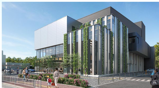
中央市民センター完成イメージ