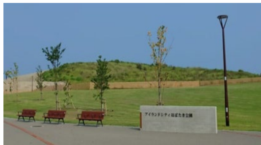
公園整備イメージ（アイランドシティはばたき公園）