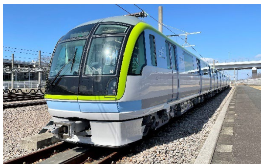
地下鉄事業イメージ