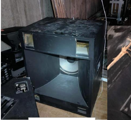
既設スピーカー (撤去後)