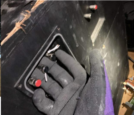
スピーカーの端子間に 指を差し込み作業