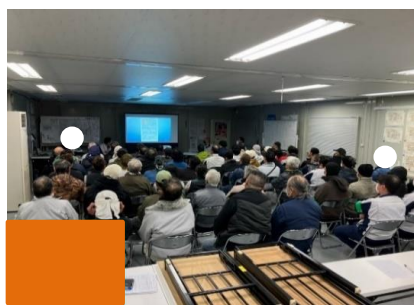
再発防止に関する安全教育状況