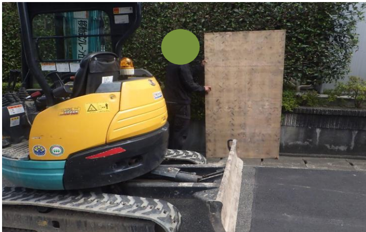
民地植栽側へコンパネの配置状況