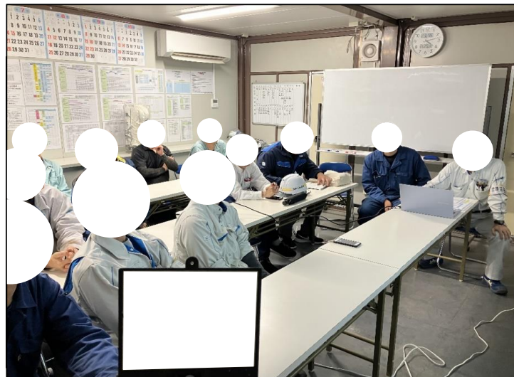
事故再発防止研修の実施状況