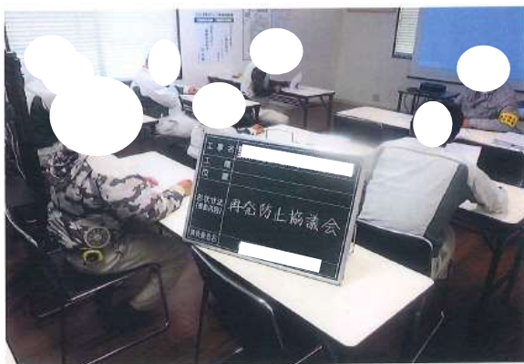
事故再発防止のための安全訓練