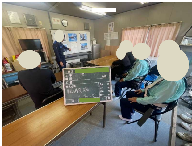
安全対策の周知状況