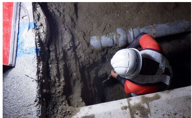
掘削時の埋設物付近手掘り状況