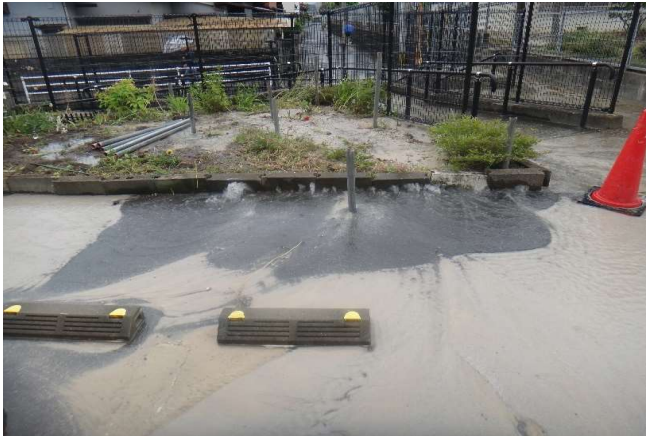
打込み単管施工中、漏水発生状況