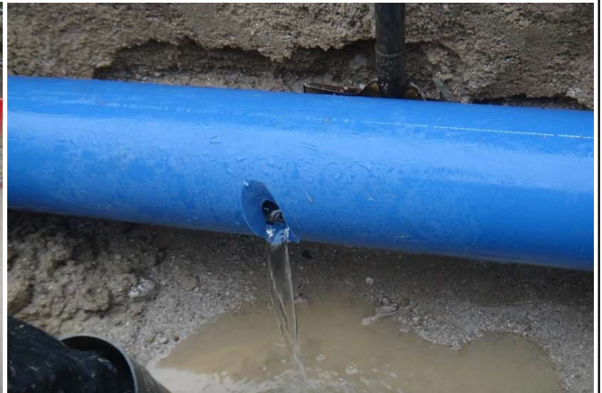
埋設給水管破損状況