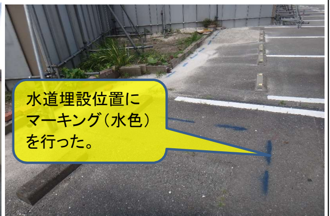
現地にての埋設配管経路確認の実施状況