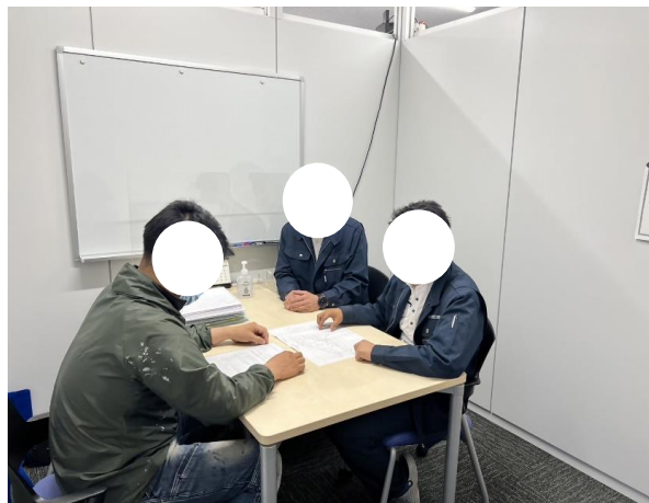
安全ミーティング状況