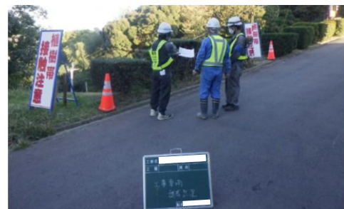
写真2) 運転者への現場説明