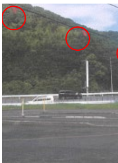
電線に安全表示旗を設置