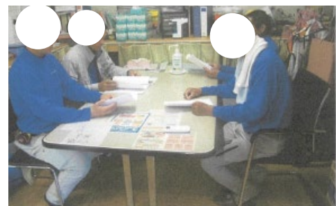
安全教育訓練を実施