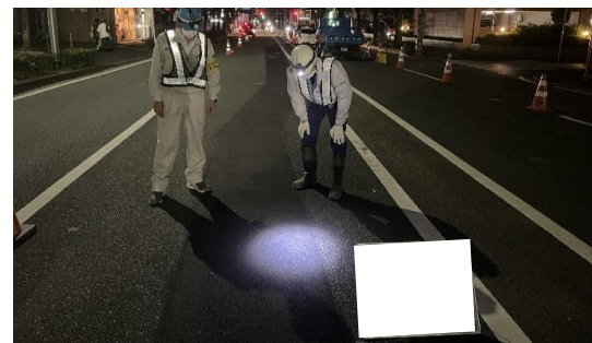
▲現場パトロール状況