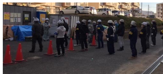
安全教育・KYによる注意喚起状況