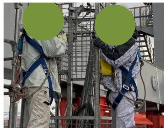
ランディングボックス扉の閉鎖状況について作業員2名によりダブルチェックを実施