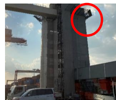
飛来落下災害防止策(朝顔)を設置