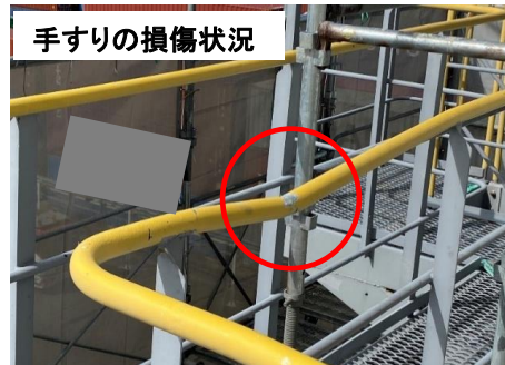
手すりの損傷状況