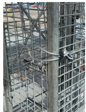
門に加え、ワイヤーチェーンを設置