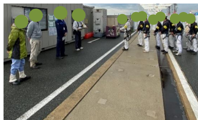
KYでの周知・再徹底