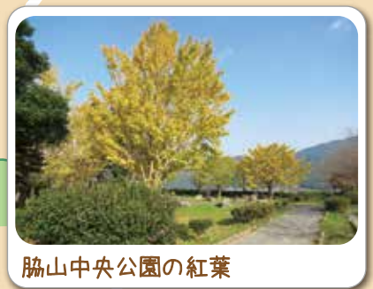
脇山中央公園の紅葉

脇山中央公園には主基齋田跡があり、脊振山と椎原川などの清流、田園風景が広がり美しい自然が満喫できるコースです。登り坂が多いので自信がある方。玄人向けです。