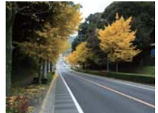
②イチョウ並木の紅葉