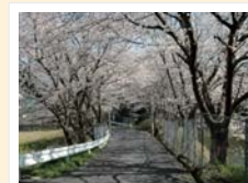
⑥箱の池と古池の間の桜のトンネル