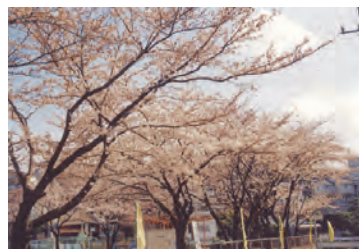
やかた橋付近の桜並木