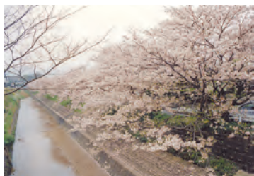
下長尾北公園の桜