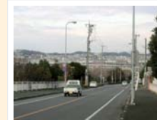
⑤ 桜原運動公園沿いの道路からの眺め