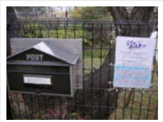
① 桜原桜の本のミニ図書館