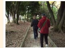
④ 大平寺緑地での森林浴