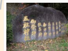
⑥ 桜原五社神社の御祭神