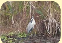
通称：八田池のアオサギ