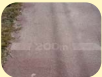
八良ヶ浦池の歩道 歩いた距離を測ることができる

ちょっと足をのばして・・・ 「向野南公園」は 「どんぐり公園」と呼ばれ 親しまれています。