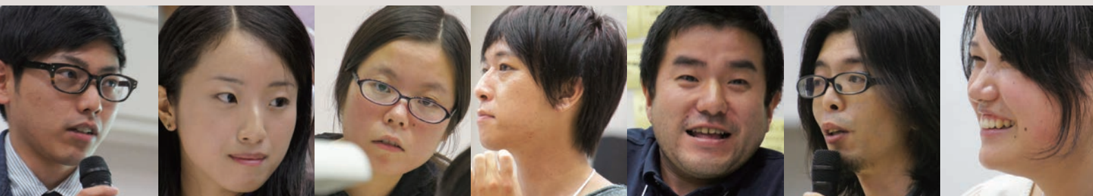
写真 / 48時間デザインチャレンジ 2013より

ユニバーサルデザインやインクルーシブデザインの考え方に基 づく新たなアイデアを生み出し、それを具体的な事業活動へと つなげるワークショップ。地域の事業者や市民へ広くユニバー サルデザインの普及・啓発を図ります。