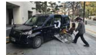
ユニバーサルデザイン(UD)タクシー ※当日会場に展示します

主催：福岡市 問合せ/ユニバーサル都市・福岡運営事務局(ラフェフェム国際放送株式会社内) TEL:092-734-5462