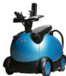
移乗・移動支援ロボット「RODEM(ロデム)」 ※会場で試乗できます。

ユニバーサルデザインの考え方に基づく優れた取り組みや製品、そのアイデア等を紹介する「ユニバーサルデザイン見本市」を開催します。選考にて、最優秀賞・優秀賞を決定するほか、会場にお越しいただいた皆さまの投票で市民特別賞を決定し、最終日には表彰式を開催します。