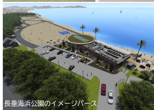
長垂海浜公園のイメージパース