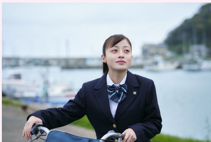
連続テレビ小説「おむすび」

福岡が連続テレビ小説の舞台になるのは約30年ぶり。福岡出身の皆さんに馴染みの深い場所でもロケをしており、地元のエキストラの方にも多くご参加いただいています。ぜひ放送をご覧ください！！