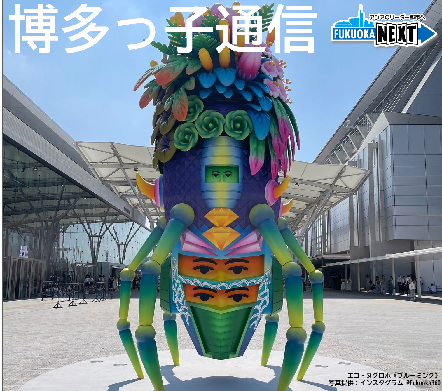
エコ・ヌグロホ《ブルーミング》