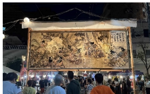
県指定有形民俗文化財 「大浜流灌頂大灯籠」2023年撮影

本展では、福岡県指定有形民俗文化財の「大灯籠絵」など約60点が、初めて一堂に集まります。