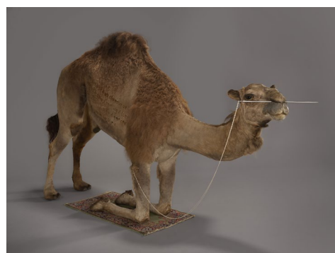
ホアン・ヨンビン(黄永砫) 【中国/フランス】《駱駝》2012年