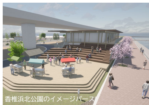
香椎浜北公園のイメージパース

香椎浜北公園は2026年春頃、長垂海浜公園は2026年夏頃それぞれオープン予定です。