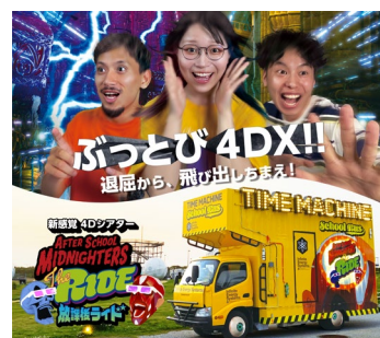
放課後ミッドナイト ザ・ライド