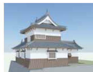
復元整備をめざす潮見櫓（イメージ）