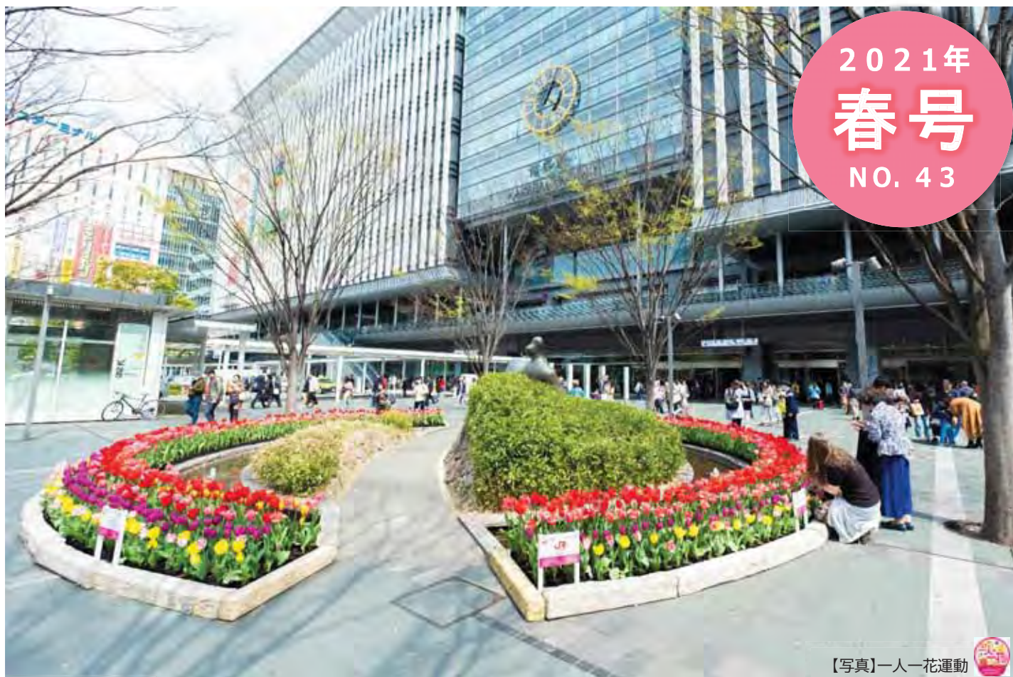
【写真】一人一花運動