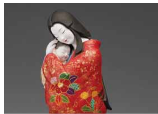
第 70 回新作博多人形展 内閣総理大臣賞 「慈しむ」馬場千代子作