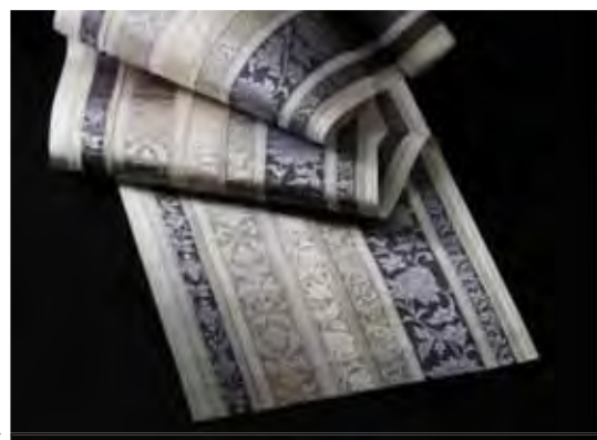
第 63 回新作博多織展 内閣総理大臣賞 「八寸なごや帯 紗目更紗文様」 原田織物(株)