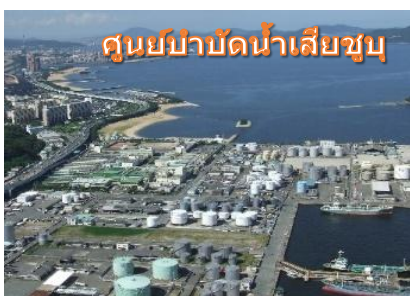
ศูนย์บำบัดน้ำเสียชุมชน