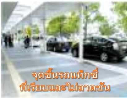
จุดขึ้นรถแท็กซี่ที่เรียบและไม่ลาดชัน