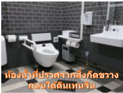
ห้องน้ำที่ปราศจากสิ่งกีดขวางถนนใต้ดินเทนจิน