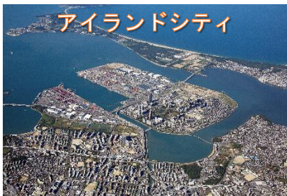
アイランドシティ