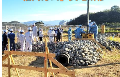
「福岡方式」 実地研修