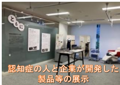
認知症の人と企業が開発した 製品等の展示