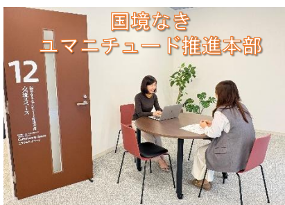
国境なき ユマニチュード推進本部