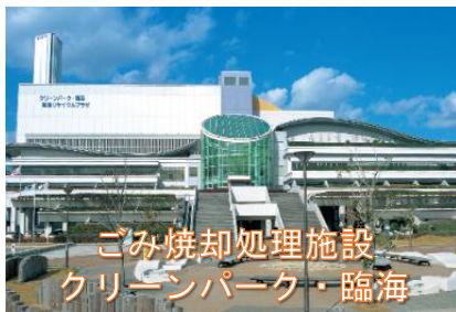
ごみ焼却処理施設 クリーンパーク・臨海