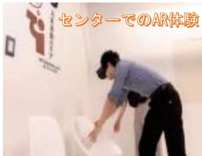
センターでのAR体験