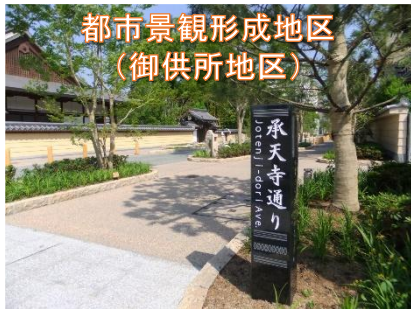
都市景観形成地区 (御供所地区)

下記分野以外につきましては、個別にご相談を承ります。 ご相談の受付については5ページをご覧ください。