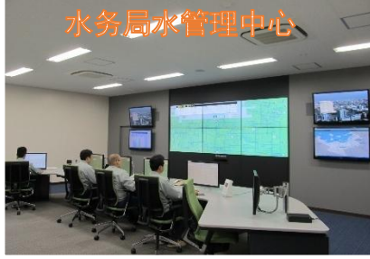
水务局水管理中心