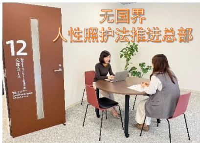
无国界 人性照护法推进总部