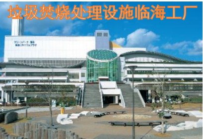
垃圾焚烧处理设施临海工厂