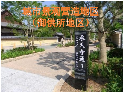
城市景观营造地区 (御供所地区)