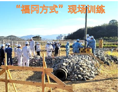
“福冈方式”现场训练