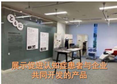
展示促进认知症患者与企业 共同开发的产品