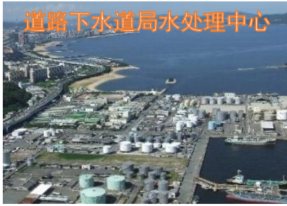
道路下水道局水处理中心