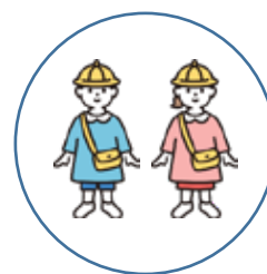
託児サービス利用