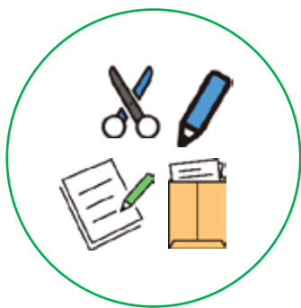
事務用品等購入 （送料含む）