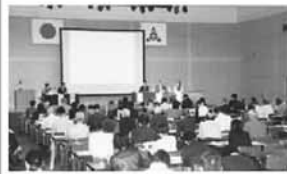
フォーラムは11回開催。53人のゲストが登場し、延べ約1,100人が参加

同プロジェクトは、大学教授など有識者へのインタビューの実施、市民参加のフォーラムの開催、論文の募集、アンケート調査の実施などに加えて、新たな手法として、100回を超える「ビジョンカフェ」(リラックスした雰囲気を作り