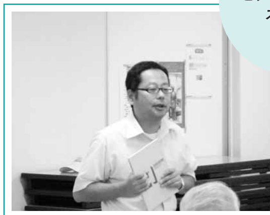
ビジョン・カフェ スタッフ