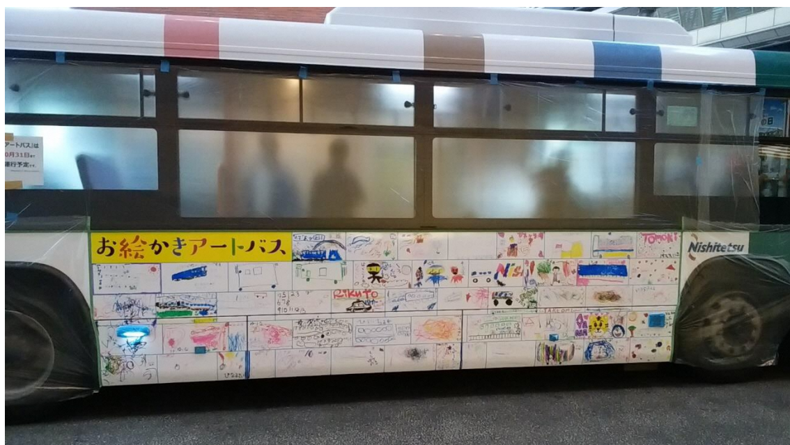
※「アートバス」イメージ

なお、2020年11月15日（日）「新天町お絵かきアートバス」のイベントをご取材いただけます。ご取材いただける場合は、別紙の参加申込書を11月13日（金）17時までに西日本鉄道(株)広報部広報課へご送付ください。この機会に是非ご取材いただきますよう、どうぞよろしくお願いいたします。