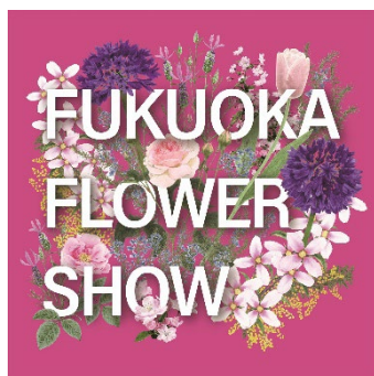
Fukuoka Flower Show 2026の キービジュアル

日程 2026(令和8)年3月22日(日曜日)～26日(木曜日) 10:00～18:00 (25日(水曜日)は21:00まで)