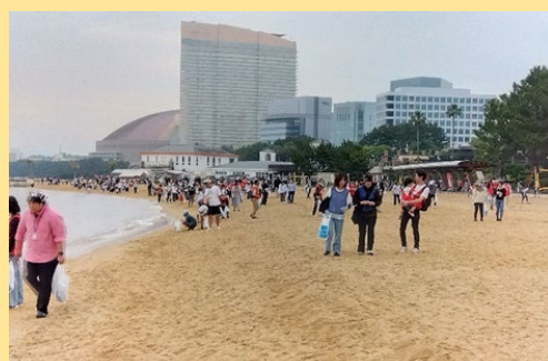
（ラブアース・クリーンアップ2025の様子）