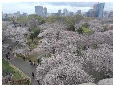
4月1日時点のソメイヨシノの開花状況