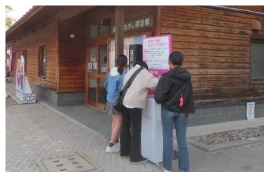
福岡城・鴻臚館スタンプラリー