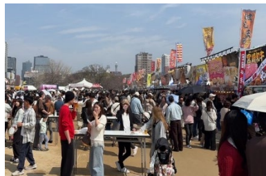
さくらグルメエリア