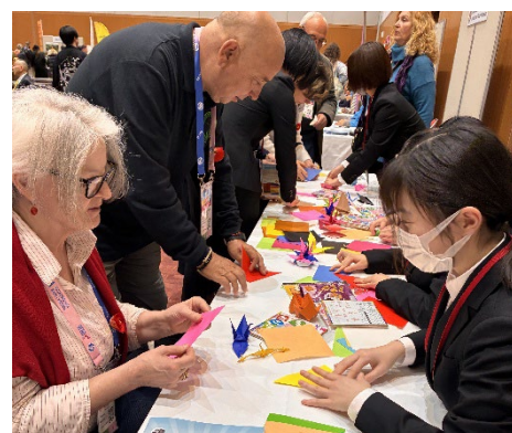
国際会議参加者向けの日本文化体験ブースの運営補助