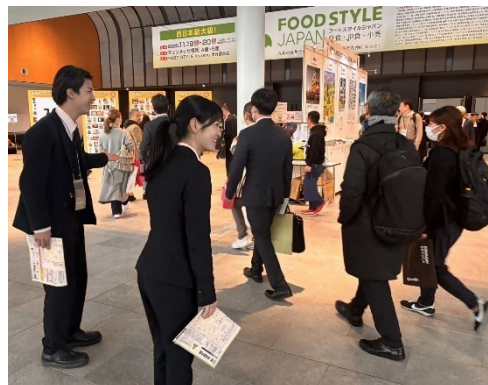
大規模展示会での運営補助体験 (マリンメッセ福岡)