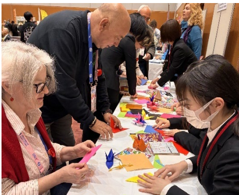
国際会議参加者向け 日本文化体験ブースの運営補助体験 (福岡国際会議場)