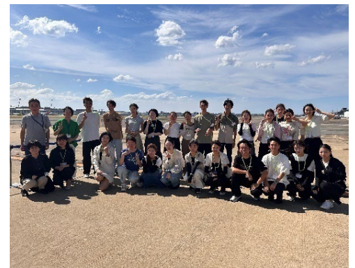
福岡空港の制限エリアも特別に見学! (福岡空港滑走路)