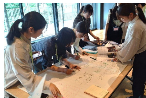
福岡を巡るインセンティブツアーを企画するグループワーク