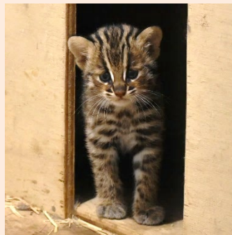
4月25日に生まれた子ネコ (6月5日撮影)