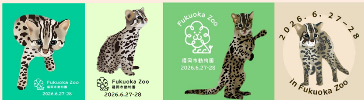
オリジナルシール