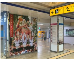
参考:昨年デザイン