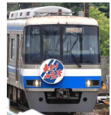
「走れ！山笠号」イメージ