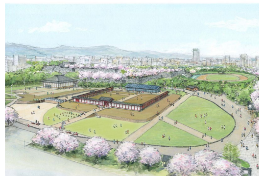
▲ 復元整備完成イメージ