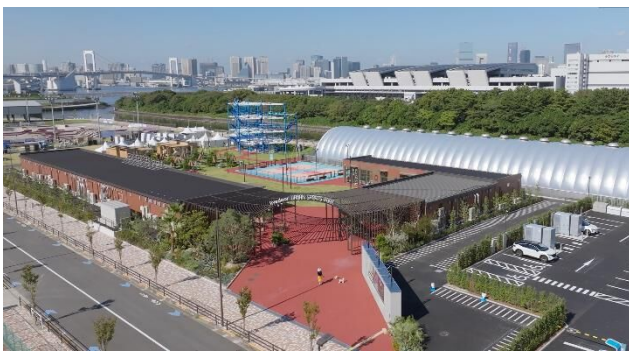
livedoor URBAN SPORTS PARK

Park-PFI事業としては、2023年に都立公園として初のPark-PFI事業となる「都立明治公園」が開園しています。開園後においても、国立競技場の目の前という立地を生かしたさまざまなイベントを開催するなど地域のにぎわい創出に取り組んでおり、2025年の年間来園者数は290万人を突破しています※3。