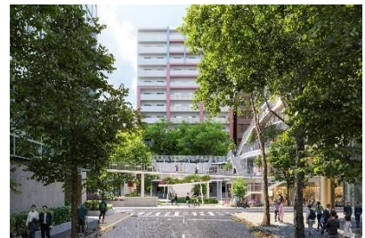
博多駅側からエントランスゲートを望む

博多駅側の公園入り口には、立体的な花壇によるエントランスゲートを計画しています。藤本壮介氏の監修による立体園路や広場等公園全体と調和したデザインとしており、「九州の陸の玄関口・博多駅前に相応しい顔」として来園者を迎えます。