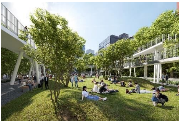
「野々にわ」・「立体園路」

公園全体を一体的かつ統一的に再構成、周辺環境と調和した計画とし、公園利用者に新たな体験価値・ライフスタイルを提供する「5つの広場」と「立体園路」を整備します。