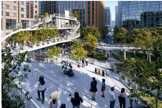
「縁のにわ」から店舗棟を望む

誰もが利用しやすい施設設計や、立体的かつ複合的な魅力あふれる空間デザインにより、周辺施設と一体となったにぎわいの連続性を生み出します。また、上りたくなる屋外階段、居心地の良いテラス、行ってみたいくなる屋上広場など、店舗利用者のみならず誰もが楽しめるオープンスペースを整備します。