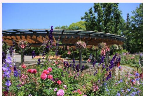
▲ エントランスガーデン南側ではイングリッシュローズを中心とした新品種のバラが見頃です

3月にオープンしたエントランスガーデンでは、これまで植物園が育ててきたバラや新しく植栽したバラ、約300種1,000株が見頃を迎えています。四季を通じて楽しめる約100種1万株の草花とともに、花と緑の魅力を感じていただけます。