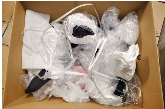
分別ワークショップで使用した混合資源