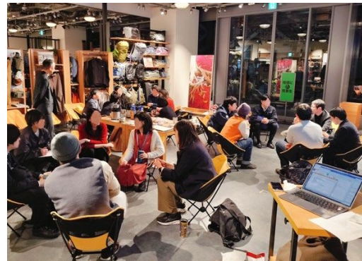
パタゴニア福岡での意見交換会の様子