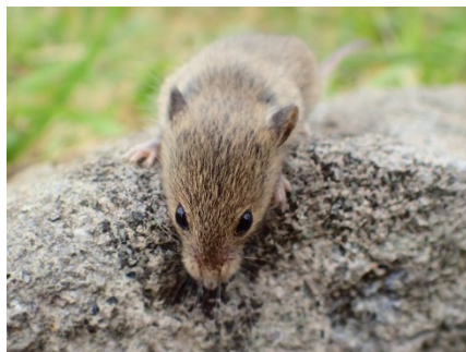
環境共生の森で見られるカヤネズミ