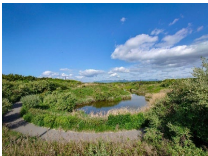
環境共生の森(愛称:みらいの森)