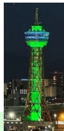
博多ポートタワー (特別ライトアップ)