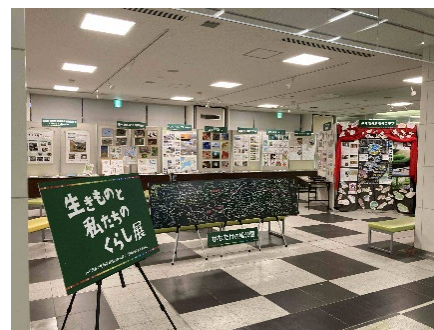
令和7年度実施の様子

【参考】生きものと私たちの暮らし展(令和7年度) (生物多様性ふくおかウェブセンター)