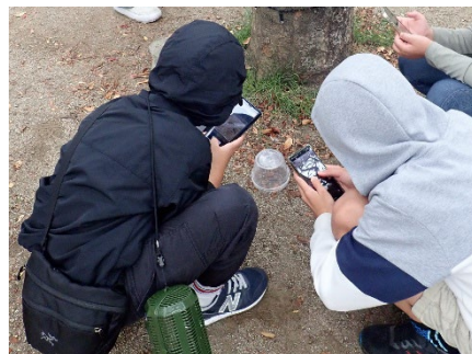
令和7年度天神編実施時の様子