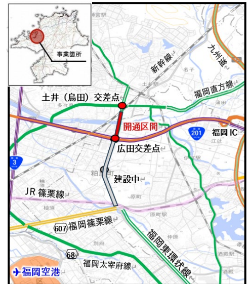
国土地理院標準地図を加工して作成