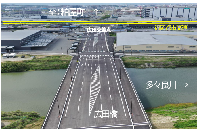
広田橋上空から広田交差点方面を望む