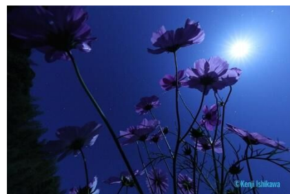
「コスモスと月」福岡県糸島半島