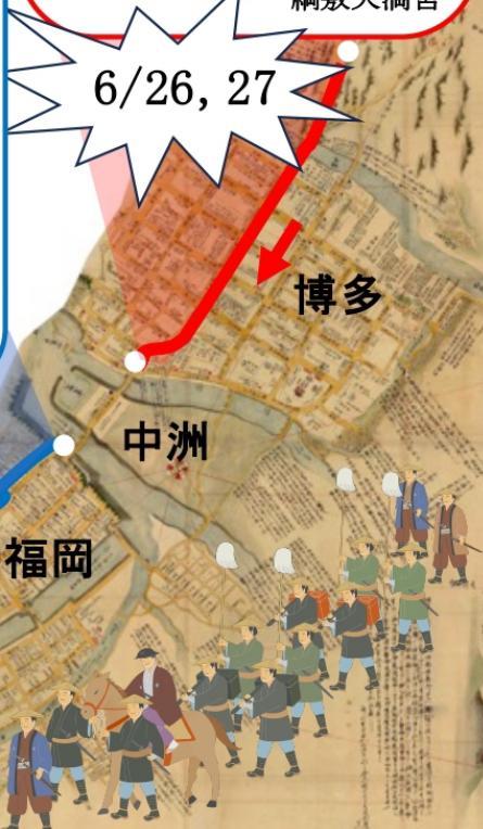
江戸時代後期の博多・福岡

文化9 (1812)年「福岡城下町・博多・近隣古図」(九大附属図書館所蔵)に追記