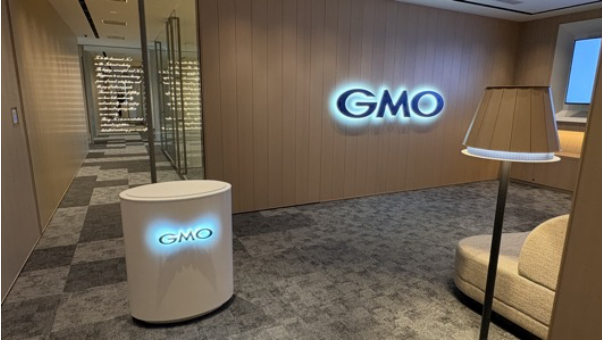
(参考：「GMO 天神オフィス」ギャラリー)