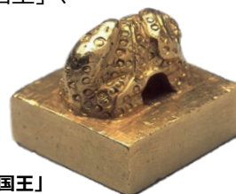
国宝 金印「漢委奴国王」