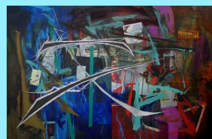
《HISTORY KEEPS ME AWAKE AT NIGHT》 2020-2021年