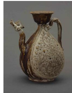
《白褐釉刻花龍鳳凰文水注》 タイ 15世紀 本多コレクション