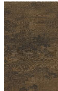
《秋景山水図》 朝鮮王朝時代 15世紀後半