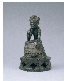
《菩薩半跏思惟像》 飛鳥～奈良時代 7～8世紀