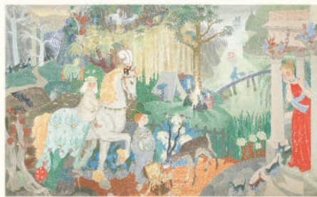
※映像で紹介予定です。

ムーミンと仲間たちの物語は、出版から80年を経た今も世界中の人々の心をとらえています。会場では、物語の一場面や、保育園のために描かれた壁画の映像演出もお楽しみいただけます。