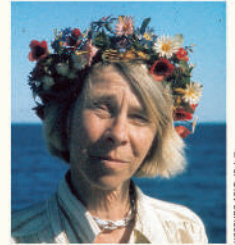
トーベ・ヤンソン (1914-2001) ヘルシンキ生まれ、スウェーデン語系フィンランド人。父は彫刻家、母は挿絵画家という環境に育ち、幼少期から画家を志す。1945年から25年にわたって書き続けた「ムーミン」シリーズは、世界各国で人気を博した。国際アンデルセン賞はか数多くの賞を受賞。