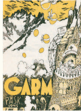
雑誌「ガルム」1945年イースター号 ムーミンキャラクターズコレクション © Tove Jansson Estate