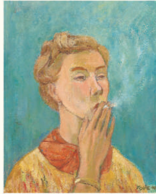
「煙草を吸う娘(自画像)」 1940年 油彩、カンヴァス 個人蔵 © Tove Jansson Estate

画家志望だったトーベは、油彩画や病院、保育園などの壁画にも取り組みました。本展では、トーベの絵画作品を始め、これまであまり知られていなかった壁画制作をフィンランドでの最新の研究成果をもとに紹介します。