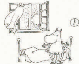
「おはよう」 制作年不詳 インク、紙 ムーミンキャラクターズ コレクション © Moomin Characters™